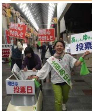
選挙戦最終日パレード